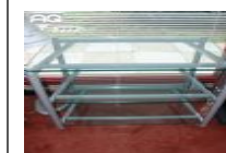
Varie Solidsteel 7.3 S € 390,00